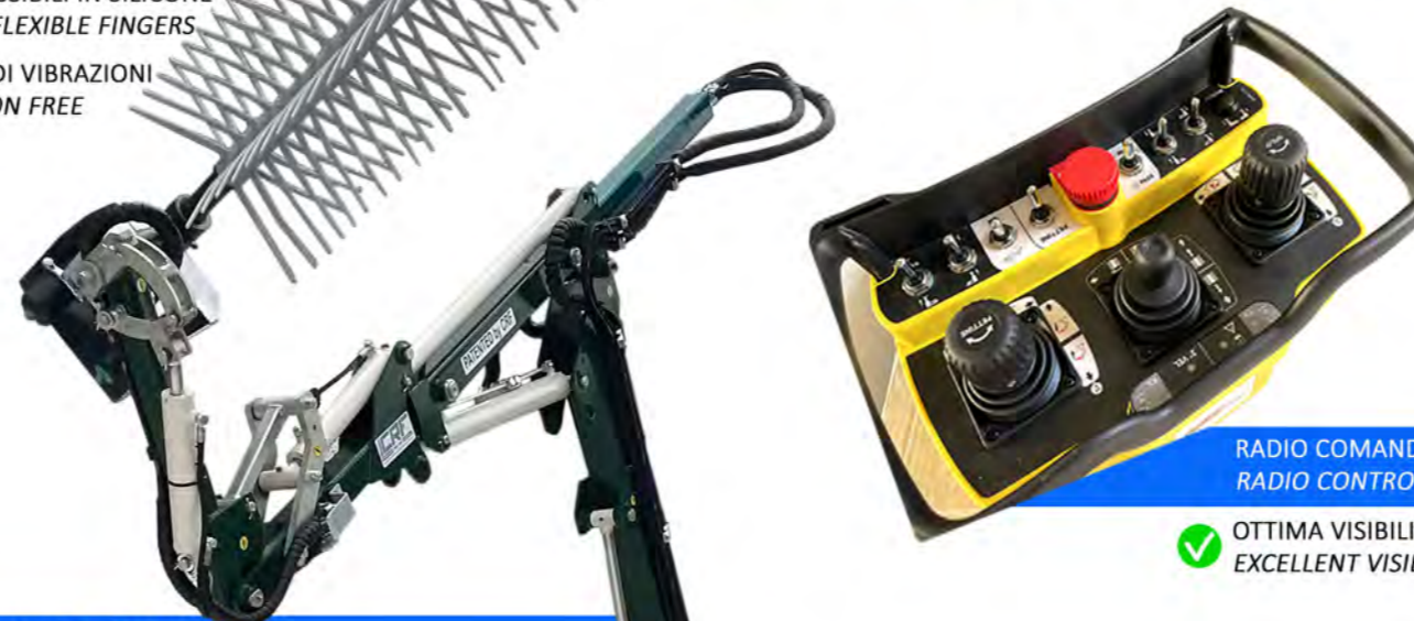
RADIO COMANDO RADIO CONTROL