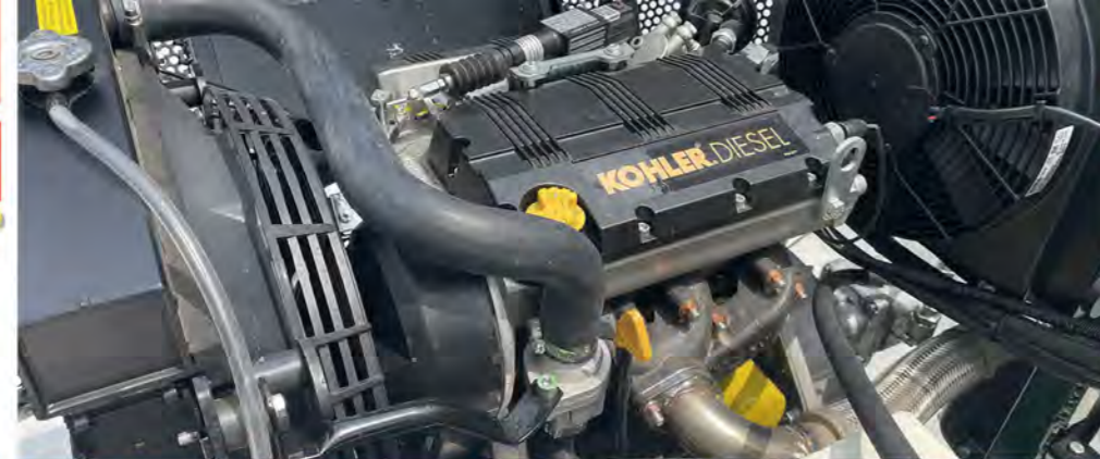
MOTORE DIESEL ED ACCESSORI DIESEL ENGINE AND ACCESSORIES